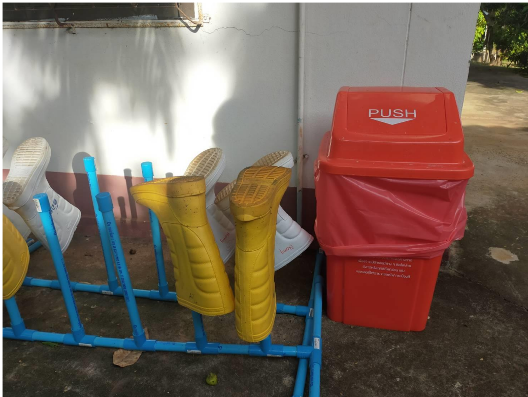
ประชาสัมพันธ์การป้องกันการระบาดของโรคติดเชื้อไวรัสโคโรนา ๒๐๑๙ (COVID-๑๙) (อบต.คำสะอาด)